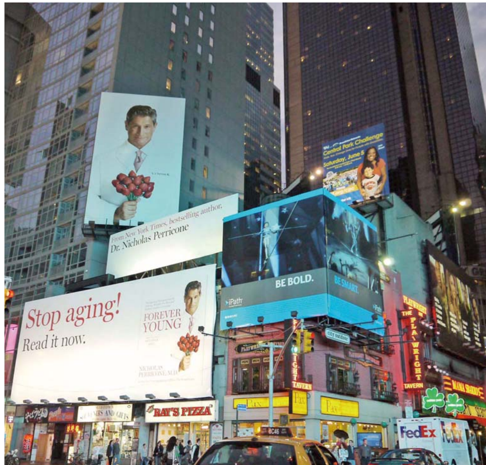
派手な広告が多く、賑やかな場所では白の広告は視認性が高い。異なる板面を連続的に使用することで、注目されるように工夫している。