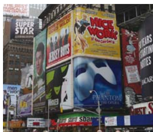
屋外広告の視認性は、周辺の色彩に左右され、派手な色が目立つとは限らない。