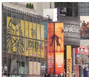
黒地に黄は注意の色、視認性が高いが、間違えと良いイメージを与えない。