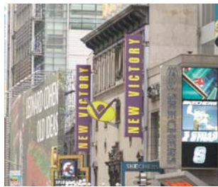
色相環で対比する補色のコントラストは、明度差に左右される。

readability=可読性、legibility=視認性、visibility=可視性、visual attraction=誘目性